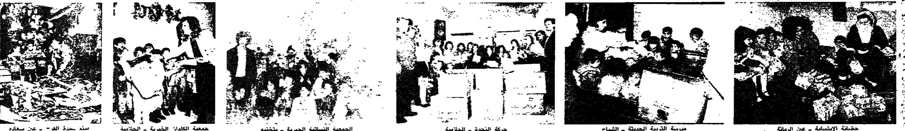
مبنى السيدة الفرح - عين سعاده

تتفاهم يوماً بعد يوم. تصوراً ان عملة جراحية بسيطة تكلف راتب الموظف لمدة ستة أو سبعة اشهر. فإمام هذا الواقع المرير ابتكرت المؤسسة ان تهر هذه المؤسسة. مناسبة الأعياد. دون ان تواسي المرضى وتعين المحرومين. وذلك بتقديم المساعدات المرضية على كافة الأصعدة وكافة المصالح والمخاوف. وتحتضن المؤسسة ان هذه المساعدات المالية والإعانات المرضية والمنح المدرسية التي تمتح للأفراد والمؤسسات والعائلات. إنما هي كالتكلم. ولو دعت وتلتبس ولو بعض الجراح والتعدي البسمة ولو بسيرة الى الوجود التي المتواضعة. وجرمان الجيل الصاعد من العلم والمعرفة والثقافة هو بحماية حرمانه من الهواء والماء والغذاء لا بل أكثر. فمؤسسة سعيد فريجه تؤمن بقدسية الكلمة وتوثيق الحرف. لكي يبقى لبنان نبراساً للعلم ومناخاً للفكر والإبداع. كما أنها ترفض ان يموت اللبني طفل المستقبل. وتعمل لكي يقبل على القرن الحادي والعشرين بعقل منفتح ومعرفة نيرة. أما عن مشكلة الاستشفاء في لبنان فحدث ولا حرج. أنها أزمة مستعصية لمناسبة عيدي الميلاد ورأس السنة المجيدتين. قامت مؤسسة سعيد فريجه للخدمات العلمية والاجتماعية. جرياً على عاداتها. ووفاء منها لمؤسس الأدار ولرسالتها السامية. بتقديم المساعدات المدرسية والمنح الجامعية والإعانات الاستشفائية والتقديمات المرضية والإنسانية والاجتماعية المتواضعة سعياً تستطيع بذلك ان تسهم بيسم ولو يسير في مجال تخفيف كابوس اليأس والشقاء عن كواهل المعزين من أبناء الوطن. كيف لا وقد أصبحت الإسطوانات المدرسية تشكل نسبة عالية من مداخل الأسر